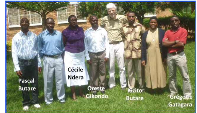
Les différents directeurs et responsables des centres de Gatagara, Rwamagana, Butare, Gikondo.

Identifier les facteurs intervenants en trésorerie, gérer les encours, surveiller les rentrées prévues, faire les rappels nécessaires, négocier les délais de paiements, les conditions d'achats... Voilà quelques uns des thèmes qui furent présentés.