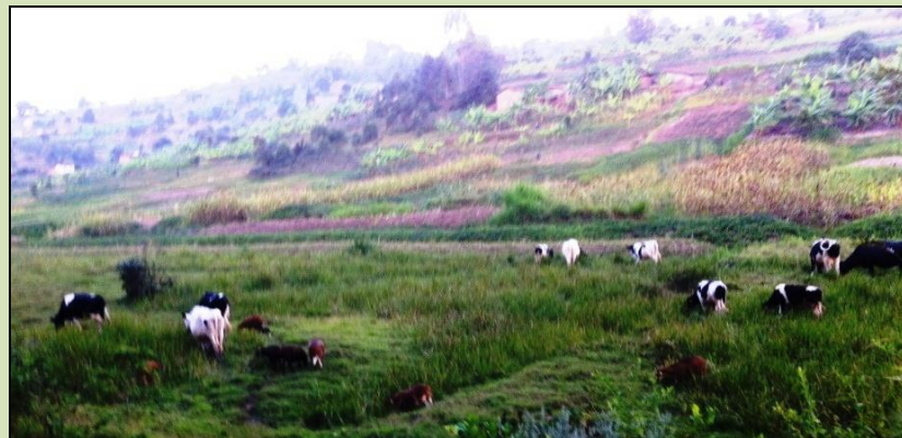
Les vaches laitières de la ferme