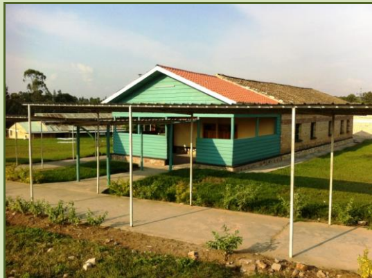
Le nouveau centre d'accueil