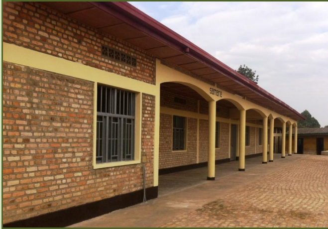
Le nouveau dortoir des filles