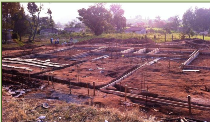
Les travaux des deux blocs de l'école professionnelle.