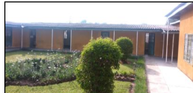
Un nouveau bloc administratif