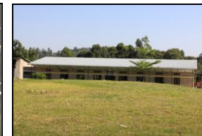
Un nouveau bloc post opératoire