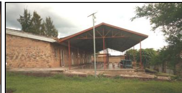
Un nouveau dortoir d'hospitalisation