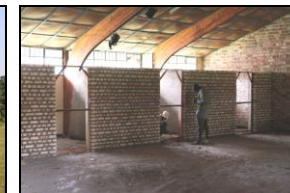
Une nouvelle kinésithérapie