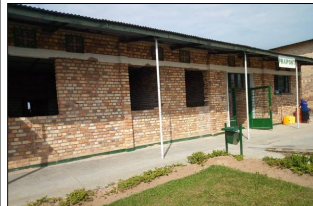
L'aménagement du nouveau bloc administratif

Le HVP Gatagara vient d'être reconnu comme Hôpital orthopédique et de Réhabilitation par le Ministère de la santé du Rwanda. Cela lui confère l'accès à la mutuelle nationale du Rwanda. Cela veut dire que toute personne soignée à Gatagara aura droit aux remboursements de la mutuelle pour ses soins. On s'attend donc à une affluence accrue de patients dans les années qui viennent. Les infrastructures doivent être adaptées à cet afflux.