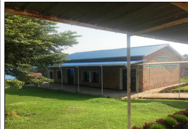
L'aménagement d'une nouvelle kinésithérapie pour les adultes