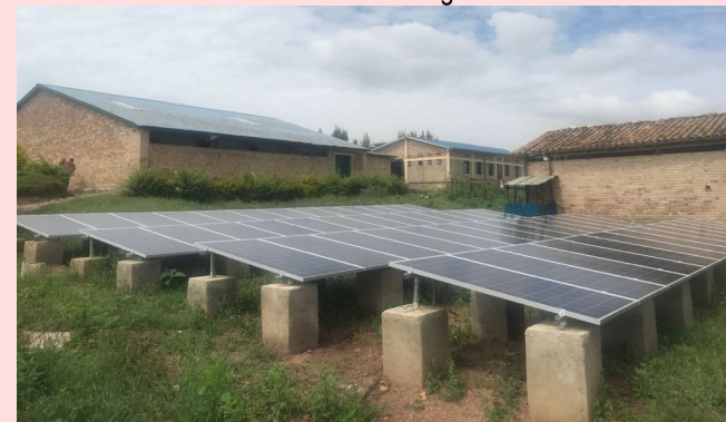
Et son électricité sera fournie par les nouveaux panneaux solaires