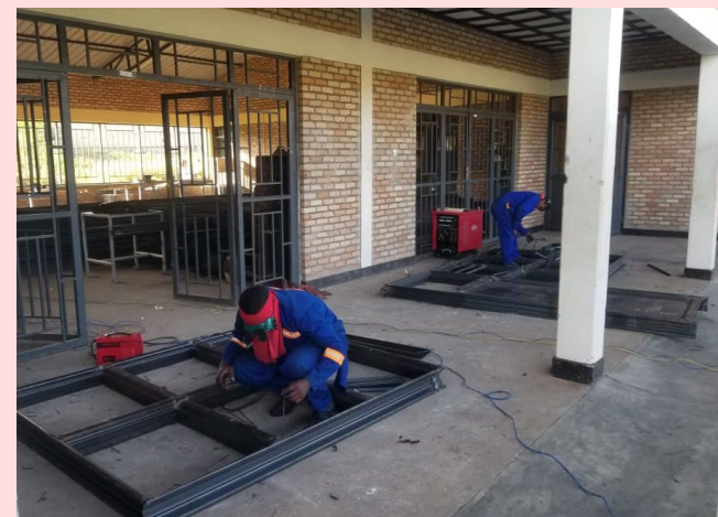
La menuiserie métallique des 3 classes a été réalisée à l'école de soudure de Gatagara.