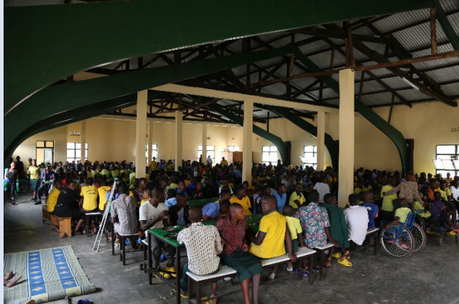
Les enfants de Gatagara Nyanza au réfectoire