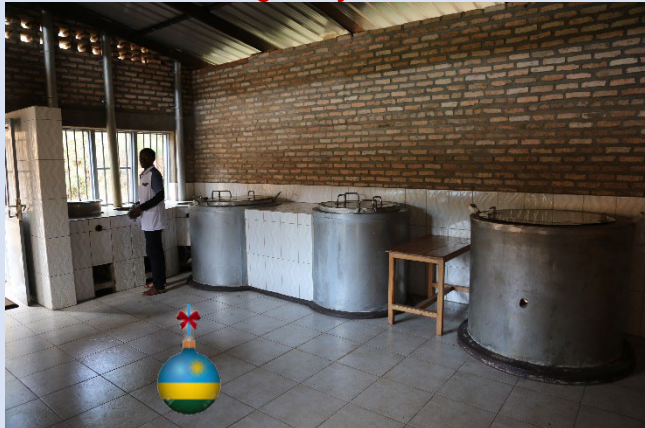
La nouvelle cuisine de Gikondo